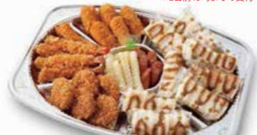
サンド/揚げもののオードブル

一口ヒレかつ・海老フライ・クリームコロッケ・ ウィンナー各5・ハーフサンド8/パック他 ----- 5,100円 一口ヒレかつ・海老フライ・クリームコロッケ・ ウィンナー各6・ハーフサンド10/パック他 ----- 6,100円 一口ヒレかつ・海老フライ・クリームコロッケ・ ウィンナー各7・ハーフサンド12/パック他 ----- 7,100円