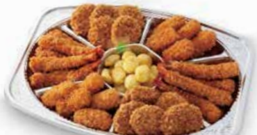
揚げもののオードブル

ハーフカットサンドヒレ10・エビ6/パック ---- 3,300円 ハーフカットサンドヒレ12・エビ8/パック ---- 4,100円 ハーフカットサンドヒレ14・エビ10/パック ---- 5,000円 ※2日前15時までの受付です。