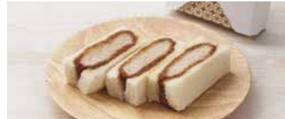
メンチかつサンド

ミニメンチかつバーガー ----- 140円 ミニポテコロバーガー ----- 160円 黒豚ミニメンチかつバーガー ----- 180円 ミニフィッシュかつバーガー ----- 200円 ミニヒレかつバーガー ----- 220円 ミニエビかつバーガー ----- 230円 ※各種バーガーは2日前15時までの受付です。