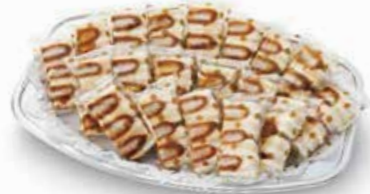
ヒレかつサンドオードブル

ハーフカットサンド18/パック ----- 3,600円 ハーフカットサンド22/パック ----- 4,400円 ハーフカットサンド26/パック ----- 5,200円