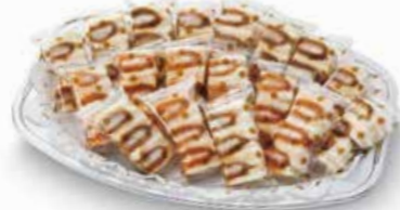
ヒレかつ/エビかつサンドオードブル

ハーフカットサンド18/パック ----- 3,600円 ハーフカットサンド22/パック ----- 4,400円 ハーフカットサンド26/パック ----- 5,200円