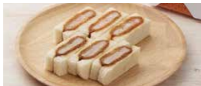
ミックスサンド(ヒレ・エビ)

3切れ ----- 390円 9切れ ----1,170円 6切れ ----- 780円 18切れ----2,340円