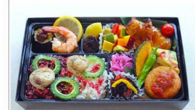
夏の彩りおもてなし弁当