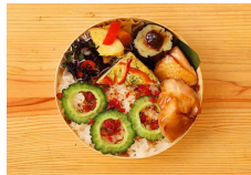
夏の彩り幕の内弁当