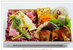
春の彩り味覚弁当 ・神山鶏の有機醤油照り焼き ・天然自身魚の唐揚げ焼き ・国産大豆使用厚揚げの含め煮 ・自然卵の特製オムレツ ・有機タケノコとごみの春ごはん