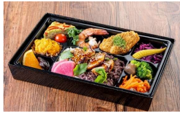
特選オーガニックおもてなし弁当