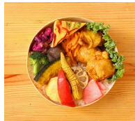
10種類野菜と タンドリーチキン弁当