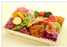
グルテンフリー おもてなし弁当