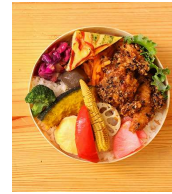
10種の野菜と 健やか鶏の胡麻香り揚げ弁当