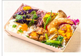
秋の彩り味覚弁当