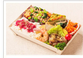
冬の彩り味覚弁当