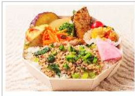
冬の彩り幕の内弁当