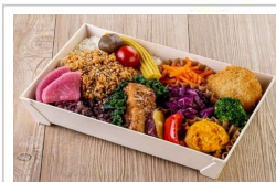
ベジタリアンおもてなし弁当