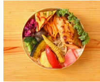
10種の野菜と 鮭の味噌胡麻マヨネーズ弁当