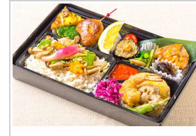
秋の彩りおもてなし弁当