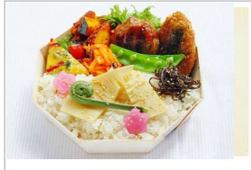
春の彩り幕の内弁当 ・神山鶏のつくね、有機醤油照り焼き ・蜜餞の香りの唐揚げ ・自然卵の特製オムレツ ・有機タケノコとごみの春ごはん