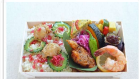
夏の彩り味覚弁当