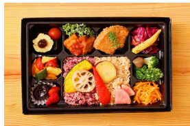
ベジタリアンオーガニック