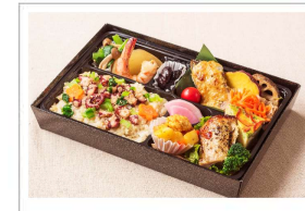
冬の彩りおもてなし弁当