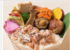
秋の彩り幕の内弁当