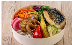
10種の有機野菜と さばの塩焼き弁当